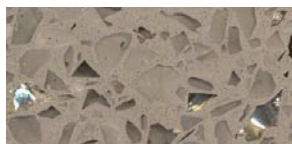
żywica Rock + kruszywo Platinum