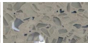
żywica Sand + kruszywo Pearl