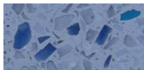
żywica Provence + kruszywo Sapphire